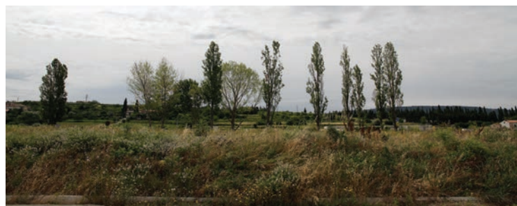
Neizkoriščeno območje ob železniški postaji bi lahko namenili za Prireditveni sejamski center

Prireditveni in sejamski center, je prostor, ki je nujno potreben na območju Mestne občine Koper. Center bo ponujal pogoje za različne dnevne ali večerne prireditve, kot so koncerti ali druge glasbene prireditve za različne generacije. Prireditveni center bomo umestil na območje Bonifike ali ob železniški postaji, kjer je veliko neizkoriščenih površin in je primerna tudi dostopnost. V centru bodo dobila mesto razna društva, ki delujejo predvsem na ustvarjalnih področjih, kot so filmsko, gledališko, glasbeno, lutkovno ali druga. V centru bomo zagotovili tudi prostor za vaje številnim domačih glasbenih skupin, ki se danes srečujejo s prostorsko stisko. V prostoru se bodo odvijali tudi večji sejmi (turistični, obrtniški, športni, logistični, avtomobilski in drugi). Sejamska dejavnost je ena od najbolj neizkoriščenih potencialov na našem območju, saj se Koper nahaja na izjemnem geografskem koridorju, ki povezuje bližnji in daljni vzhod ter druge dele sveta z Evropo. Koper bo postal ena od pomembnih evropskih sejamskih destinacij.