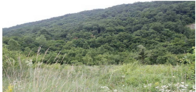
Območje ob reki Dragonji je primerno za Center za duhovno rast in alternativne oblike zdravljenja

za vse željne širših in poglobljenih znanj o številnih oblikah za samopomoč in o oblikah zdravljenja, ki so v sožitju z naravo. V centru se bo odvijala: predavanja o zdravi prehrani (vegetarianstvo, presnojedstvo in drugo), svetovanja, meditacije, različne vrste joge, masaž, gong kopeli in kopeli s tibetanskimi