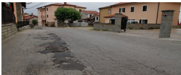
... tudi v Šmarjah...