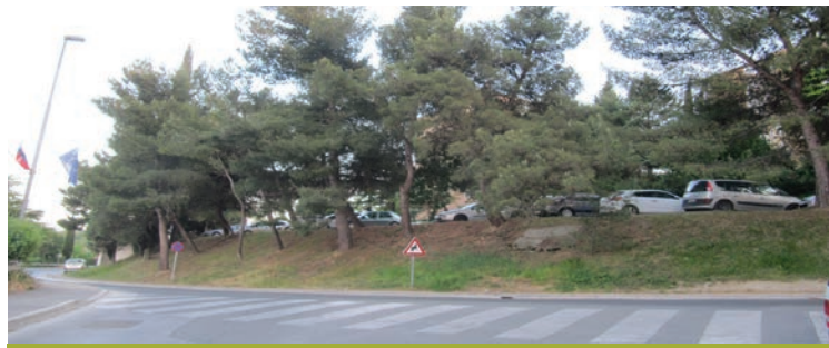
Pri križišču Sergeja Mašera/Cesta na Markovec...

V Kopru bi zgradili mestno garažno hišo ob stadionu Bonifika, ki bi s tremi etažami na površju in dvema podzemnima etažama zagotovila 3.000 parkirnih mest. Zavzeli se bomo, da se parkirišče pri tržnici vkoplje pod zemljo in pri tem pridobi do 400 novih parkirnih mest in tako zagotovi prostor za druge namene, predvsem parkovne površine.