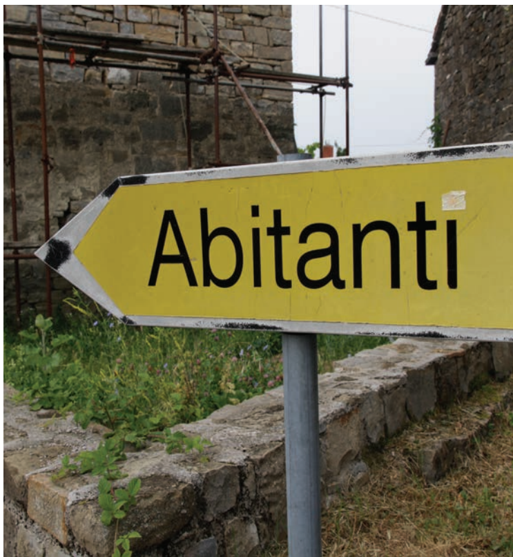
Priskrbeli bomo vodo Abitantom in še drugim 7 vasem, ki je še nimajo

Pripeljali bomo vodo in vodovodna omrežja v zadnjih 8 vasi brez vode in zamenjali bomo vse dotrajane in okolju škodljive azbestne cevi. Gre za zadnjih 8 od 105 vasi v Mestni občini Koper, kjer še vedno ni niti osnovnih pogojev bivanja, zato je dograditev vodovodnega omrežja ena osrednjih točk programa, s katero bomo pripomogli tudi k temu, da se bo vse več ljudi naselilo v zaledna območja mesta in tako oživel vasi. Ko bomo prav vse prebivalce priklopili na vodovodno omrežje, bomo uveljavili tudi projekt zamenjave starih azbestnih cevi z novimi, ki so prijazne okolju in ljudem. Kar dve tretjini območij MOK še vedno nima urejene kanalizacije, zato bomo z realizacijo teh osnovnih investicij veliko doprinesli tudi okolju v katerem živimo.