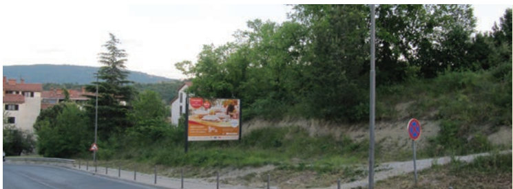
Pri Semedelskih razgledih bomo uredili dvo etažno garažno hišo