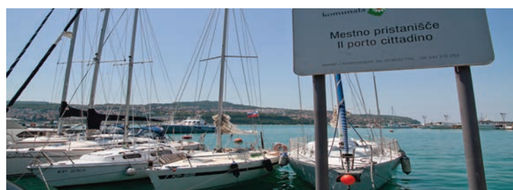
... bomo uredili še več komunalnih privezov