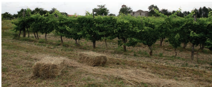
... in kmetijstvo.