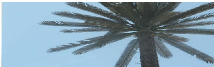
Oddajnike za brezžični internet lahko »skrijemo« tudi v umetne palme

Brezžična internet občina, na večini javnih površin in prav vseh krajih v zaledju, kjer internetnih povezav ni, bomo usposobili brezžične oddajnike za internet, ki je ena od osnov informacijske družbe in družbe znanja. Vsem bomo omogočili varen in hiter dostop do interneta, brez katerega je danes težko živeti. V krajih, kjer ni internetnih omrežij, bomo zagotovili brezplačen internet, ne