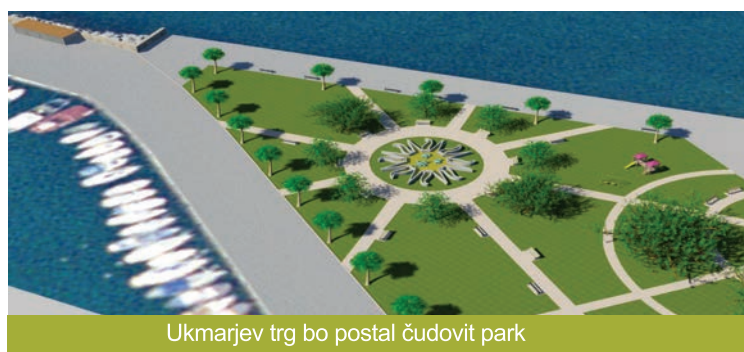
Ukmarjev trg bo postal čudovit park