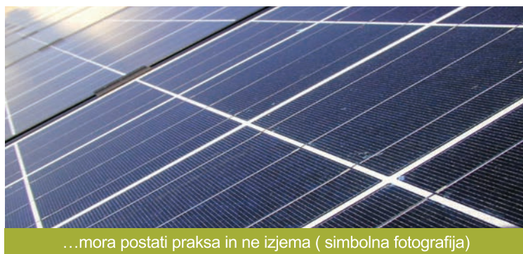
...mora postati praksa in ne izjema ( simbolna fotografija)