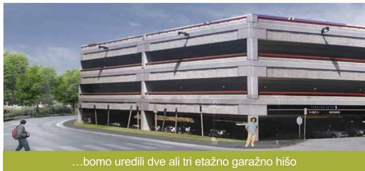
...bomo uredili dve ali tri etažno garažno hišo