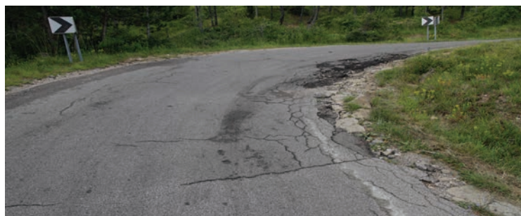
...pa tudi cesto proti Brezovici pri Gradinu...