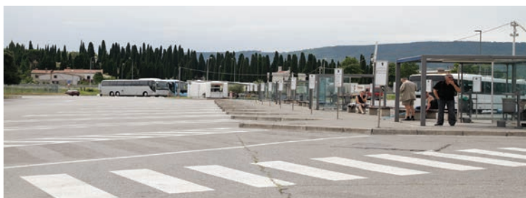
Manjše avtobusne postaje bomo uredili v okviru treh Mikro obrtnih družbenih con na podeželju

Javni prevoz je ozko grlo razvoja Mestne občine Koper. Je povsem neučinkovito, neprijazno do okolja in številnih prebivalcev zaledja ter nenazadnje obiskovalcev in dnevnih migrantov. Uveljavili bomo jasno strategijo, ki bo omogočila vsem poceni javni prevoz, ki bo spoštoval najvišje okoljske standarde. Vzpostavili bomo redno avtobusno krožno linijo, ki bo vozila okrog Kopra nekaj krat na uro (na primer vsakih 10 - 15 minut), saj bomo s tem zagotovili ustrezne možnosti prevoza vsem tistim, ki imajo gibalne težave, predvsem starejšim in invalidom. Učinkovita javna mestna avtobusna linija bo bila za številne obiskovalce Kopra najboljša alternativa zamudni in dragi vožnji z osebnim vozilom. Vzpostavili bomo tri redne avtobusne linije: ena, kot rečeno, bo obkrožila Koper, druga bo povezala garažno hišo s Trgom Brolo in Cankarjevo ulico, tretja pa bo povezala smer Belvederja oz. občinske stavbe do zdravstvenega doma. Avtobusno linijo bodo v tem primeru zagotavljali ekološki mini avtobusi na električni pogon, ki ne bodo obremenjevali okolja s strupenimi izpusti. V primeru, da bi bil javni prevoz učinkovit, bi garažna hiša ob stadionu Bonifika tudi dejansko postala osrednja parkirna lokacija. Lokacija ob stadionu Bonifika je tudi logistično najbolj učinkovita za osrednje mestno avtobusno vozlišče, saj omogoča povezave do vseh delov mesta v največ 10 minutah hoje, bodisi do koprskega pomola, Titovega trga ali v smeri Luke Koper oz. železniške postaje.