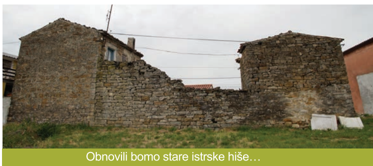
Obnovili bomo stare istrske hiše...

Obnova občinskih zapuščenih stavb, k temu bomo pristopili projektno, sprva z ugotovitvijo vsega zapuščenega in neuporabljenega nepremičnega premoženja Mestne občine Koper. Obnovo oz. oživitev bomo vpeljali tako v mestnem jedru, kot v zaledju, kjer ima občina v lasi vrsto zapuščenih nepremičnin.