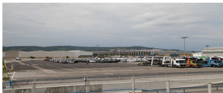
Na določenem območju luke Koper bi lahko zrasla tudi Prosta ekonomska cona za obrtnike in podjetnike

Prizadevali si bomo, da se v okviru koprskega pristanišča v skladu z evropskimi predpisi uredi večja površina, ki bi bila namenjena izvajanju izvoznih visoko tehnoloških dejavnosti. Z ustanovitvijo posebnih infrastrukturnih pogojev, ki bi zagotavljali tudi posebne davčne ugodnosti, bomo lahko na našem območju ustanovili svetovno razpoznavno lokacijo, kjer bi se izvažali proizvodi ali storitve z zelo visoko dodano vrednostjo v vse države sveta. Zelo pomembno je, da se bodo s pomočjo take cone zagotovila nova delovna mesta, pristanišče pa bi pridobilo še večjo mednarodno veljavo.