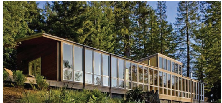
Center za duhovno rast in alternativne oblike zdravljenja bo v sožitju z naravo

skledami in druge dejavnosti. Najbolj primerna lokacija za center je podeželje, kjer je še veliko neokrnjene narave in zelenja. Prizadevali si bomo, da tako lokacijo najdemo na območju reke Dragonje.