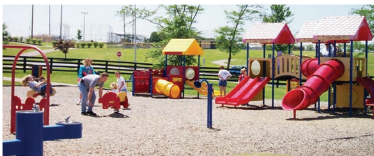
Vsak zeselek, vsaka vas bo dobila otroško igrišče