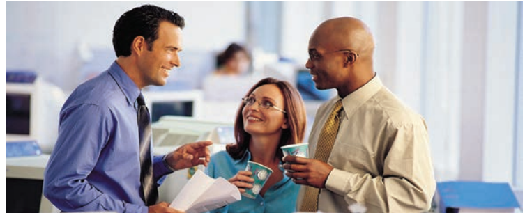
Zagotovili bomo do 1.000 novih delovnih mest (simbolna slika)

transparentna in razpršena, saj bodo tako onemogočeni monopoli. Vsak podjetnik ali obrtnik bo imel enake možnosti nastopanja