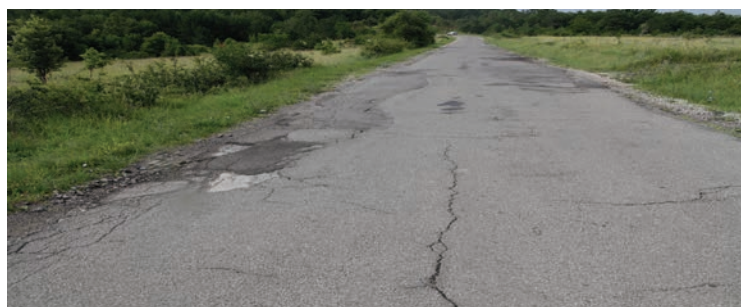
...ter tudi cesto proti Butarijem ter vse ostale podželske ceste v MOK