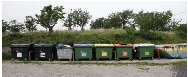
Postavili bomo veliko več različnih zabojnikov za ločeno zbiranje odpadkov

Mesto brez odpadkov / okolju najbolj prijazna občina, Koper bo moralo postati najbolj čisto mesto v Sloveniji, ki bo po tej specifikaciji poznano tudi v mednarodnem prostoru. Enkrat letno bomo priredili vsesplošno generalno čistilno akcijo okolja v okviru Dneva zemlje, v katero bi vključili vse javne zavode, šole, vrtce in čim večje število občanov. Poleg tega bomo vzpostavili ustrezno službo, ki bo zadolžena za čiščenje divjih odlagališč odpadkov ter sanacijo teh območij. Uredili bomo pogoje za ločevanje odpadkov, in sicer veliko bolj učinkovito kot do sedaj, na način, da bomo ločevali steklo, pločevinke, plastenke, plastiko, biološke odpadke, papir in karton, ostalo embalažo, odpadno električno in elektronsko opremo, nevarne gospodinjske odpadke, kosovne odpadke, zeleni obrez ter listje in ostalo po potrebi. V mestu, na Markovcu, Olmu, Prisojeh in Semedeli bomo uredili podzemne zabojnike, tako da bodo ulice veliko bolj prijazne do okolja. Na podeželju bomo postavili veliko več komunalnih zabojnikov za ločeno zbiranje odpadkov, tako da bomo ločevali lažje in bolj učinkovito.