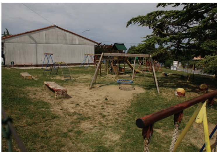
Vrtec in šola na Škofijah ter drugod po MOK bomo prenovili

na mesto v vrtcu, kar je nesprejemljivo. Čas gre hitro dalje in vsak izgubljen dan, je en dan preveč. Tem otrokom odraščanje v okolju vrtca ne bo moral povrniti nihče.