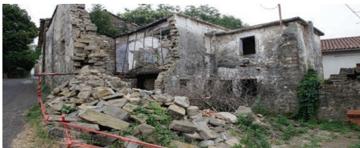
...in jim dali primerno vsebino.

Zlasti v zaledju vidimo veliko potencialov, saj bomo začeli s projektom izdelave celostne turistične poti, kar bo prispevalo k razvoju gospodarstva, turizma in samega zaledja. Del praznih hiš oz. stanovanj bomo namenili socialno ogroženim in mladim družinam, ki si ne morejo privoščiti nakupa ali dragega najema stanovanja. S tem bomo oživel stare hiše v mestu in na podeželju, hkrati pa občanom v stiski omogočili boljše življenjske pogoje.