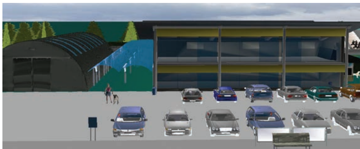
Prostori za poslovne dejavnosti vezane na živali

veterinarsko službo, fitosanitarni inšpektorat in ostale strokovne službe, ki se ukvarjajo z živalmi in bi tako delovale na skupni lokaciji. Ustvarili bomo zaokroženo celoto, kjer bomo živalim zagotovili primeren prostor, ki je postavljen na pomembnem prehodu med mestom in podeželjem.