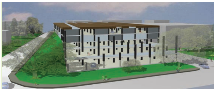
Zgradili bomo večjo garažno hišo na Markovcu pri trgovini