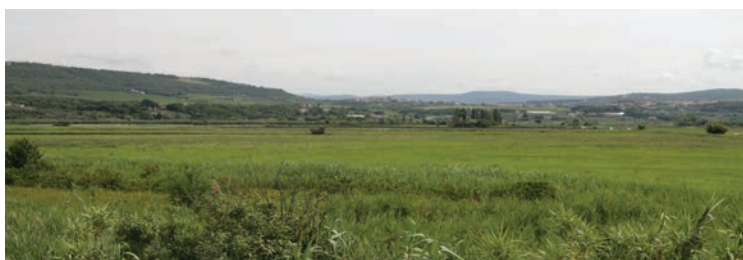
Neizkoriščene površine na Serminu bi lahko namenili za določene vsebine kot npr. za Versko kulturno središče

Po volitvah se bomo zavzeli, da bo vsaka narodno priznana vera dobila večji center, kjer bodo lahko verniki opravljali svoje verske programe v dostojnem in mirnem okolju. Pošteno je, da vse kulture in vere dobijo možnost lastnega centra za verske in kulturne prireditve. Na ta način se lahko posamezniki med seboj družijo, gojijo in izpopolnjujejo svoja verska prepričanja v urejenem okolju. S tem bomo dejansko dokazali visoko stopnjo demokratičnosti in sprejemanja ljudi vseh narodnosti ali verskih prepričanj, ki živijo v Kopru. Koper bo tako postal zgledno medkulturno in medversko mesto, ki spoštuje vse ljudi. Taki centri bodo lahko dobili svoje mesto na Serminu, ki je v bližini mesta in kjer je še veliko neizkoriščenega prostora