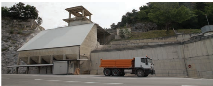
Namesto kamnoloma v Črnem Kalu...

Občinska uprava bo zagotovila komunalno opremljanje območja ter pogoje zakupa oz. najema zemljišča po simbolni ceni, kar bo povečalo zanimanje podjetij in obrtnikov, da opravljajo svoje dejavnosti v Mestni občini Koper, kjer bodo prispevali k dvigu dodane vrednosti na prebivalca.