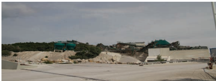
...ali kamnoloma pri Černotičih bi lahko zrasla mikro industrijska cona.