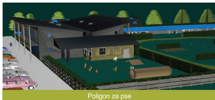
Poligon za pse