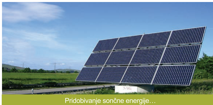
Pridobivanje sončne energije...

sprehajalne poti z mediteranskim rastlinjem. Zavzeli se bomo, da se vozila pred bolnico Izolo namestijo v garažo in na njeni površini uredijo sprehajalne površine in park. Zavzeli se bomo tudi za to, da se bo pri domu upokojeencev uredil večji park; ravno tako bomo uredili park pod garažo na Krožni cesti.