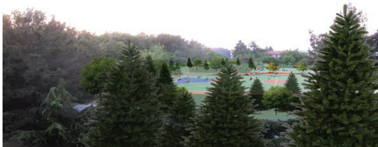
Na območju Prisoj ob blokih Cesta na Markovec bomo uredili večje športne površine

Zagotovili bomo postavitev otroških postavitev otroških igrišč na vsako poseljeno območje, s poudarkom na podeželju, kjer je ta problematika zanemarjena. Otroci imajo pravico do igranja in urejenih površin, kjer lahko preživijo svoj prosti čas. V sodobnem življenju si ne predstavljamo bivalnega okolja, tako v mestu, kot v primestju ali podeželju, ki nima urejenih ustreznih površin za otroke. Na žalost je danes stanje tako, da veliko vasi še vedno nima otroških igrišč za najmlajše. Zato menimo, da je prav, da vsaka vas ali zaselek dobi svoje otroško igrišče. Pogoji za naše otroke morajo biti enaki v vseh delih občine, ne glede na to, kje posamezni otrok stanuje.