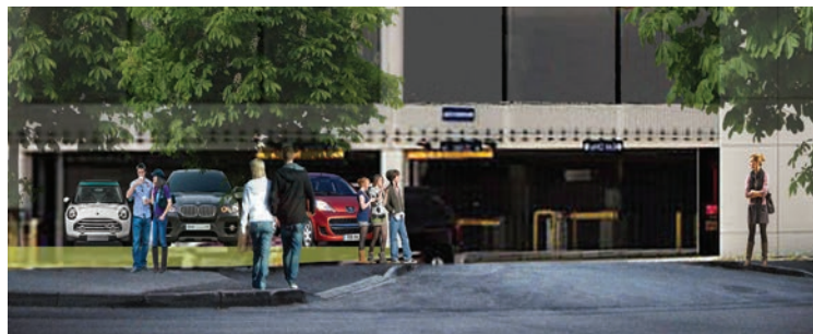
bomo povečali tako, da bo rešena parkirna problematika