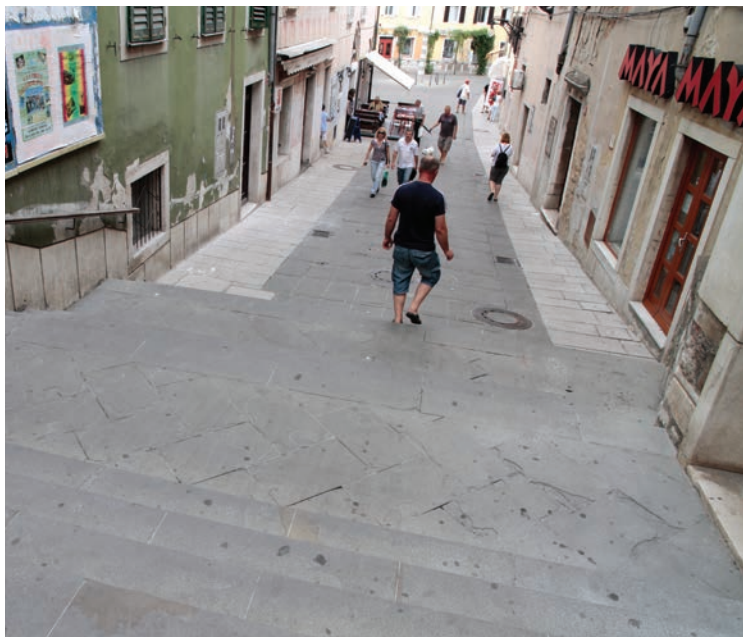
Koper bo postal prijaznejši do gibalno oviranih oseb

Koper bo postal najbolj prijazna občina do invalidov oz. gibalno oviranih oseb. K projektu bomo pristopili nemudoma po volitvah, saj je stanje na področju javne infrastrukture, ki je prijazna do invalidov ali gibalno oviranih, porazno. Tem skupinam bomo omogočili varen in lahek dostop do vseh javnih objektov in na vseh javnih površinah. Zasebniki, ki opravljajo dejavnosti na območju Mestne občine Koper bodo morali pristopiti k projektu in se zavezati, da bodo omogočili pogoje za dostop do svojih lokalov oz. objektov. Vrsta objektov v starem mestnem jedru in ostalih delih mesta namreč nima urejenih dostopov za telesno hendikepirane osebe. Pri novih gradnjah je sicer opaziti, da se postopoma gre v smer urejanja prijaznih površin za gibalno ovirane osebe, se pa hkrati zanemari obstoječa infrastruktura. Zato bomo uresničili zamisel, da tudi Mestna občina Koper pristopi k urejanju vseh javnih površin in objektov, da lahko postanejo dostopne za vse, predvsem pa za gibalno ovirane osebe. Opozarjamo na to, da sta Mestna občina Ljubljana in Mestna občina Maribor že ponosni prejemnici listine za invalidom prijazno mesto. Mislimo, da bi bilo zelo lepo, če bi se jima pridružila tudi Mestna občina Koper, za kar se bomo zavzeli po volitvah.