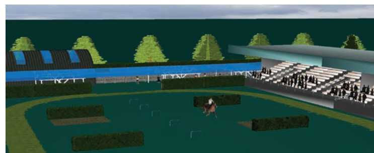
Površine za tekmovanja in druge ekshibicije