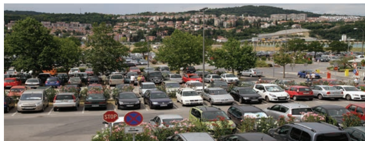
Vozila pod površje, namesto njih mediteranski park