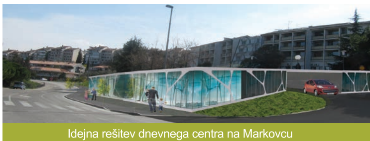
Idejna rešitev dnevnega centra na Markovcu

Dnevni center za medgeneracijsko druženje, namenjen bo tako starostnikom, kot najmlajšim, ki bi v skupnih prostorih našli