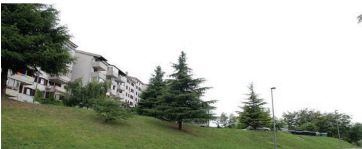
Na območju pod Kozlovičevo ulico bomo uredili dvoetažno garžno hišo