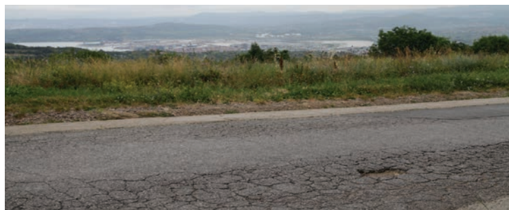
Cesto na Gažonu bomo sanirali...

100 kilometrov obnovljenih cest na podeželju, kar zajema sanacijo vseh občinskih cest in aktivno reševanje problematike prenove državnih cest, kar je bilo zanemarjeno kar 9 let. Obnovljen bo povsem zanemarjeni in razpadajoči cestni odsek Bivje - Ankaran in regionalne ceste Rižana - Kubed - Gračišče - Sočerga in sv. Anton - Brezovica. Uredili bomo tudi vse ostale ceste na podeželju, ki so danes v poraznem stanju. Vse ceste na območju Mestne občine Koper morejo biti varne, da se lahko vsak občan pelje varno proti svojemu domu. V današnjem času je to osnovni pogoj za zagotavljanje kakovosti bivanja na podeželju, z večjo urejenostjo cest bomo tudi pripomogli k večjemu naseljevanju na podeželje.