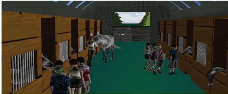
Hlevi za konje