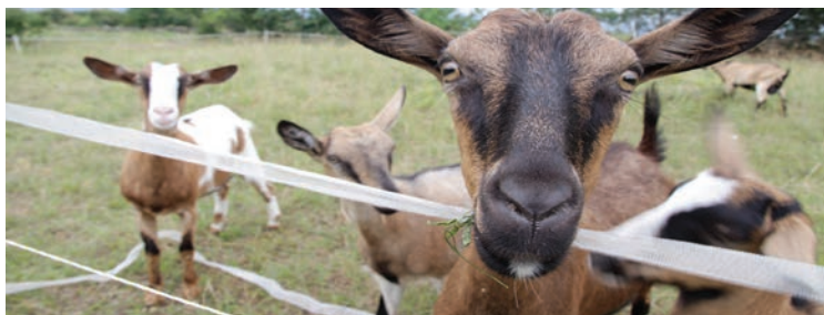
Spodbujali bomo živinorejo....

Koprsko zaledje ima pomembno preteklost na področju zagotavljanja kmetijskih izdelkov širši regiji. Zagotovili bomo sredstva in subvencije za pospeševanje kmetijstva, ekološko pridelavo in se zavzeli za to, da bodo vsi javni zavodi v Mestni občini Koper, šole, vrtci in drugi, nabavljali prehranske izdelke pri domačih predelovalcih hrane. S tem bomo ponovno spodbujali razvoj kmetijstva, obenem pa ustvarili tudi nova delovna mesta oz. dodatne prihodke na področju kmetijstva. Cilj je doseči, da bo občina postala samozadostna z vidika ustvarjanja kmetijskih pridelkov za potrebe svojih javnih zavodov. Na ta način bomo zagotovili, da se javni denar porablja za domačine in s tem ustvari pomemben krog od proizvodnje do potrošnje na lokalni ravni.