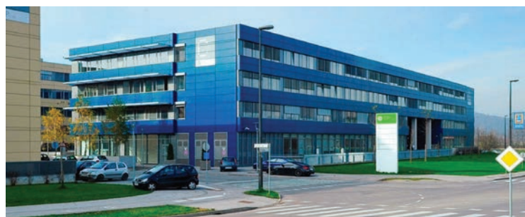
Tehnološki park v Ljubljani

Tehnološko - razvojni park, razvil se bo v sodelovanju z univerzo in gospodarstvom, ki bi nudil tudi vrsto storitev na znanstveno - raziskovalnem področju in aplikativne uporabe znanja. Tehnološki park bo bil tudi sedež za inovativna podjetja, katerim bi omogočilo številne oblike intelektualne in laboratorijske pomoči. V tehnološkem parku bomo ustvarili okolje, ki je prijazno do inovativnega podjetništva, ki deluje predvsem v segmentih tehnologije. Park bo valilnica za podjetja z najvišjim potencialom rasti, saj bo zagotavljal pogoje, da se inovativna zamisel čim prej spremeni v konkreten proizvod ali storitev in se po hitrem postopku plasira na trg.