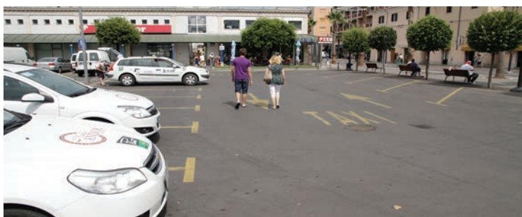
V okviru mikro obrtnih družbenih con na podeželju bomo uredili javni taxi prevoz

V podeželju bomo uvedli posebne subvencionirane taksi prevoze (avti oz. kombiji) na klic, ki bodo povezovali vse vasi in zaselke, praktično vse hiše, s tremi novimi mikro obrtnimi in družbenimi conami, ki bodo zgrajene na območju KS Gračišče, KS Črni Kal in KS Šmarje. V okviru teh con bo tudi posebno avtobusno postajališče, ki bo povezano z mestom. Na ta način bodo javni prevozi med Kopro in podeželjem veliko bolj pogosti in prijazni do ljudi.