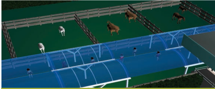
Hlevi za domače živali

prostore za konje domačinov, ki nimajo primerne prostora za njihovo vzgajanje. Na lokaciji bomo uredili tudi trgovine za živali,