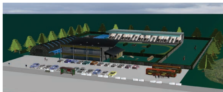
Center za domače živali

Gradnjo centra načrtujemo na večjem zemljišču ob cesti proti Tribanau. V centru bo delovalo tudi zavetišče za pse. Poleg tega bomo uredili večji prostor za pasje, konjske in druge prireditve, kot so lepotna tekmovanja, razstave in drugo. Na območju bomo uredili tudi hleve za konje in druge domače živali in manjši živalski vrt z domačimi živali. Živalski vrt bo lahko služil tudi za pedagoške procese osnovno in srednješolcev. V hlevih bomo zagotovili tudi