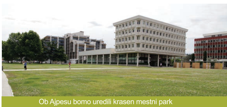
Ob Ajpesu bomo uredili krasen mestni park