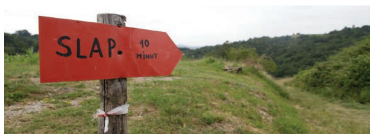
Spodbujali bomo razvoj turizma na podeželju (npr. slap v Trebešah)

je eden najpomembnejših projektov. Uravnorežen razvoj vseh delov mesta je pogoj za enakopravnost vseh občanov Mestne občine Koper. Projekt uravnoreženega razvoja je sestavljen iz različnih programskih točk, kot so ureditev javne cestne, prometne in komunalne infrastrukture, javnih prevozov, programov za podeželje in številne druge. Pretiran blišč, ki se je v zadnjih 9 letih ustvarjal na zelo majhnem delu mestnega središča, je na drugi strani povzročil znatno škodo v zanemarjenih delih mesta in podeželja. Sanacija te neuravnoreženosti in vzpostavitev družbe, ki je enaka za vse, je ena od prioritet Oljke. S projektom uravnoreženega razvoja celotnega mesta bomo nemudoma začeli s postopki za spremembo volilnih enot, iz sedanje ene na dve, kar bo omogočilo, da bo število svetnikov v koprskem mestnem svetu enako za tiste, ki bodo prihajali iz mesta in tiste, ki bodo prihajali iz podeželja. Zavzeli se bomo za to, da bo en podžupan imenovan izključno s pristojnostmi za podeželje, drugi pa za mesto. Zavzeli se bomo tudi za to, da se vzpostavijo decentralizirane enote Mestne občine Koper tudi na podeželju, saj bomo s tem mestno upravo približali ljudem.