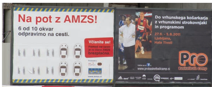
Spoštovali bomo dvojezičnost

Ci impegneremo ad attuare una nuova politica che rispetti tutte le regole nel campo della salvaguardia dei diritti della comunità nazionale italiana. In tal modo forniremo le condizioni adatte per la difesa e lo sviluppo della minoranza italiana. Non permetteremo più che questi diritti siano calpestati e con la nostra gestione del Comune citta' di Capodistria non sarà più possibile presentare in tutta la città cartelloni pubblicitari che non siano bilingui.