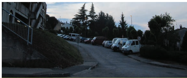
Garažno hišo v Prisojah...