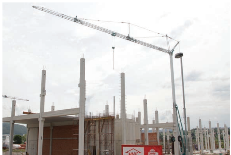
Poleg obrtne cone na Serminu, bomo zgradili še tri Mikro obrtne družbene cone na podeželju

Zgradili bomo mikro obrtno družbene cone, kjer bi delovali obrtniki, podjetniki in ostali, ki imajo danes svoje storitvene ali proizvodne obrate znotraj svojih domov. S tem bomo omogočili, da se gospodarski razvoj mesta ne seli izključno v središče mesta, temveč se bo enakomerno razvijal v vseh delih, tudi v zaledju, kar je pomembno zlasti za razvoj podeželja. Z vpeljavo treh obrtno - gospodarskih razvojnih osi bomo lahko zajezili beg obrtnikov in podjetnikov na Kozino in jih zadržali na našem območju ter privabili še podjetja z drugih delov Slovenije. V okviru teh con bi dobili mesto ambulante, javni servisi, manjše trgovine. Postavili