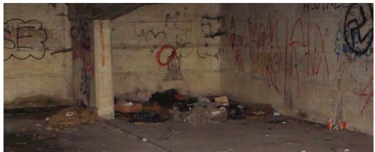
Poskrbeli bomo, da bodo tudi garžne hiše na Markovcu redno čiščene