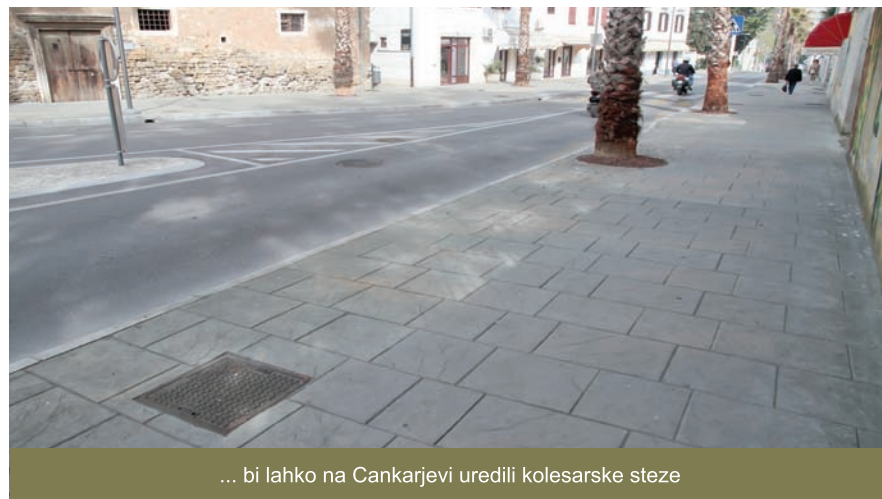
... bi lahko na Cankarjevi uredili kolesarske steze