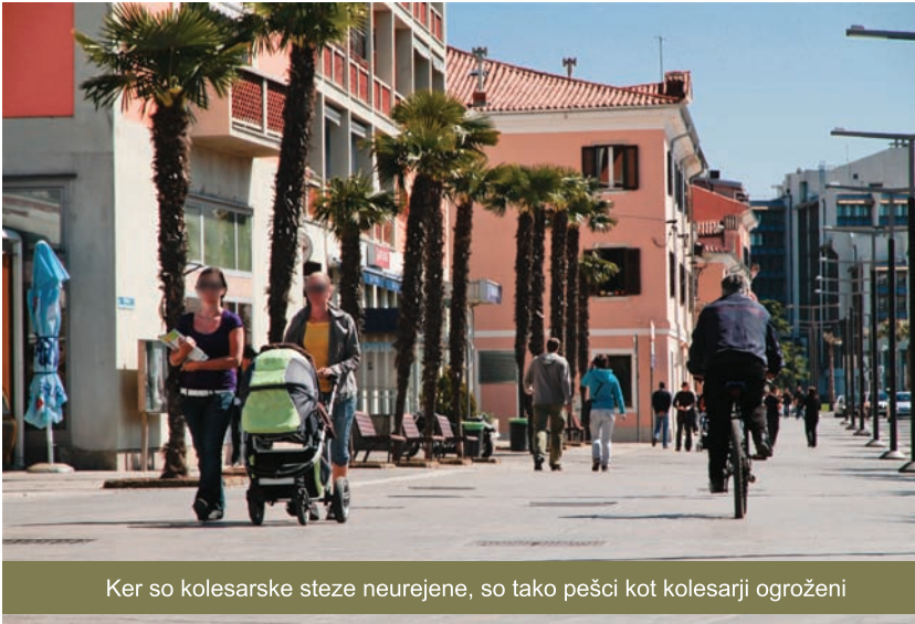
Ker so kolesarske steze neurejene, so tako pešci kot kolesarji ogroženi

Na lokaciji ob koprskem stadionu, kjer smo predlagali izgradnjo garažne hiše, bi se lahko postavilo tudi osrednje postajališče in izposojevalnica za kolesa. Kolesarska postajališča bi se nato postavila še na drugih lokacijah po Kopru (na primer tržnica, plaža, potniški terminal, trg Brolo, vhod v Luko Koper, Muzejski trg, Ribiški trg, železniška postaja itd.). Hkrati bi lahko uredili še vse neurejene ali neoznačene kolesarske steze, kot na primer na Pristaniški in Cankarjevi ulici. Tak projekt, s katerim občinska uprava omogoča obiskovalcem ali prebivalcem mesta brezplačno ali zelo poceni uporabo koles, se je uspešno vzpostavil v Ljubljani, kar je dokaz, da je dobre in koristne ideje možno tudi uresničiti, če obstaja prava volja.