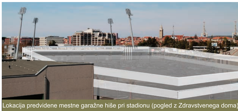
Lokacija predvidene mestne garažne hiše pri stadionu (pogled z Zdravstvenega doma)

Pred nekaj dnevi smo v Oljki – stranki slovenske Istre predstavili javno pobudo za izgradnjo garažne hiše ob koprskem stadionu, ki bi lahko bila brezplačna, saj bi se tako razbremenile prenasičene javne in parkirne prostore v koprskem mestnem jedru. S tem bi se ustvarili boljši pogoji za vse, obiskovalce in predvsem prebivalce koprskega mestnega jedra. Taka garažna hiša v predmestju bi lahko služila za vse tiste, ki prihajajo v Koper iz drugih krajev. V samem mestnem jedru bi bilo dovolj parkirnih mest za nas prebivalce in bi se lahko dokončno odpravila diskriminatorna omejitev odloka o prometni ureditvi, po katerem pripada vsakemu gospodinjstvu le ena parkirna dovolilnica. Vsak občan s stalnim prebivališčem v koprskem mestnem jedru bi tako imel tudi pravico do brezplačnega parkiranja na plačljivih