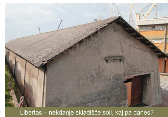
Libertas – nekdanje skladišče soli, kaj pa danes?

Kopski turistični potenciali so nešteti in jih je potrebno začeti izkoristiti takoj, saj moramo ciljati na višjo kakovost turizma. Nesmiselno je, da se turisti, ki v Koper priplujejo s čezoceankami, z avtobusi vozijo v Lipico, Postojno ali Ljubljano, mimo Kopra. Tem in drugim turistom, pa tudi domačinom, bi morali ponuditi ogled kopskih zgodovinskih bogastev, saj bi s tem pripomogli tudi k njihovem ohranjanju. Po občinskih volitvah bomo jasno začrtali novo politiko turizma v Kopru, ki bo zaustavila in ne bo več dopustila vnosa tujkov v mesto z bogato kulturno