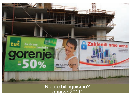
Niente bilinguismo? (marzo 2011)