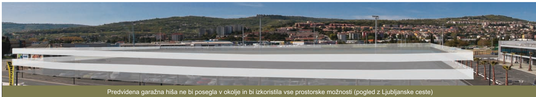
Predvidena garažna hiša ne bi posegla v okolje in bi izkoristila vse prostorske možnosti (pogled z Ljubljanske ceste)

Garažna hiša bi hkrati rešila težave, ki nastajajo ob večjih prireditvah na ŠRC Bonifika ali drugih lokacijah v Kopru, ko so lastniki avtomobilov prisiljeni parkirati na vse možne načine in s tem posegajo v pravice tistih, ki v Kopru živijo in nimajo možnosti normalne uporabe avtomobilov. Niti, da bi se v miru pripeljali do svojih domov. Le v primeru, da bi se postavila garažna hiša ob stadionu na Bonifiki, bi bilo smiselno ohraniti plačljiva parkirna mesta v koprskem mestnem jedru, po vzoru drugih obmorskih mest.