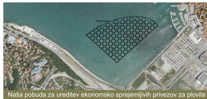
Naša pobuda za ureditev ekonomsko sprejemljivih privezov za plovila

Politika oživljanja mestnega jedra ne daje vidnih rezultatov. Razen promenade mesto čedalje bolj sameva. Poslovni lokali in trgovske dejavnosti se redčijo, prebivalci mestnega jedra smo prisiljeni k vse bolj pogostim izhodom iz mesta, da bi si zagotovili osnovne dobrine. Kje so tisti prijetni časi, ko smo videvali nasmehe otrok v mestu? Občinska oblast je porušila osnovno šolo in stavbo na Ukmarjevem trgu, srednja tehniška šola se je preselila v nove prostore izven mesta, univerza bo gradila študentski kampus v predmestju, selile se bo tudi občinska uprava in druge javne službe itd. Sprašujem se, ali obstaja načrt, po katerem bo koprsko mestno jedro postalo spalno mesto?