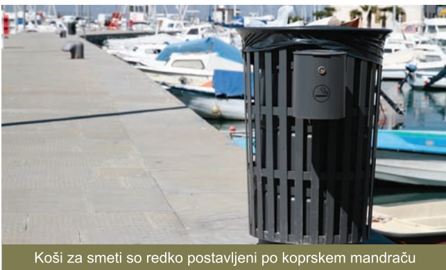
Koši za smeti so redko postavljeni po koprskem mandraču