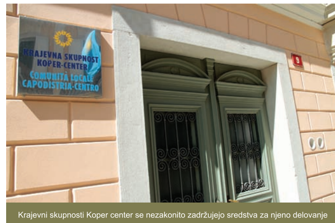
Krajevni skupnosti Koper center se nezakonito zadržujejo sredstva za njeno delovanje

Prebivalci kopskega mestnega jedra si zaslužimo večjo pozornost s strani tistih, ki upravljajo občino. V zadnjih letih pa prihaja do obratnega, saj smo prav mi tisti, ki smo najbolj izpostavljeni negativnim političnim in razvojnim odločitvam. Občinska uprava si že nekaj let jemlje pravico onesposobiti delovanje KS Koper – Center preko nezakonitega zadrževanja financiranja njenega delovanja. Šele lani smo dosegli pravnomočnost odločbe, ki nam je dodelila sredstva za delovanje v letu 2006. Zadrževanje sredstev za delovanje naše KS se ponavlja in nadaljuje še danes. Da bi prišli do sredstev (2007-2011), ki nam pripadajo, smo prisiljeni sprožiti vrsto tožb. Tako početje, zadrževanje sredstev KS Koper - Center s strani kopske mestne uprave, je nedopustno, žaljivo in neodgovorno do vseh prebivalcev mestnega jedra. Ali smo mi manjvredni krajanji? Ali si v svoji krajevni skupnosti ne zaslužimo enakih pogojev delovanja kot drugi? V čem je razlog, da se odkrito kršijo zakoni in se za tako početje porabljuje vrtooglavi zneski občinskega denarja za plačilo dragih odvetniških uslug? Občina dobesedno meče proč denar za odvetniške storitve in za pravljanje, čeprav je že vnaprej znano, da bo občina te spore izgubila.