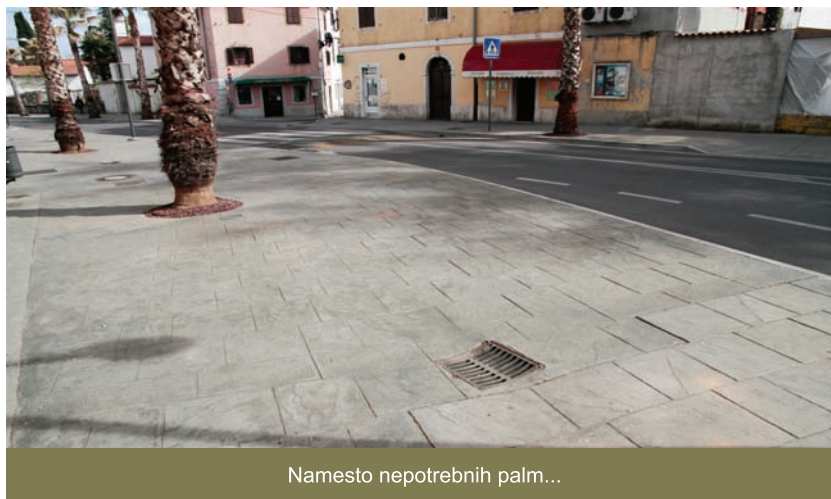
Namesto nepotrebnih palm...

Kolesarskih poti za mlajše in druge uporabnike koles so neurejene ali pa jih sploh ni. Zelo koristne bi bile kolesarske steze na Cankarjevi ulici, kjer so na žalost palme po nepotrebnem zasedle prometno površino za kolesarje. Podobno je na ostalih prometnicah, kjer se je pri obnovi zapravila dragocena možnost, da bi Koper postalo kolesarjem prijazno mesto. Kolesarskih poti ni na delu Pristaniške od tržnice do kopališča, tako da se morajo pešci pogosto izogibati hitrim kolesarjem, da ne bi prišlo do trka. Kljub široki promenadi in Smedelski cesti niso praktično nikjer označena parkirna mesta za kolesarje. Nova šola ima sicer veliko kolesarnico, vendar kako naj si otroci z njo pomagajo, ko ni ustrezno označenih kolesarskih poti? Ali naj svojim otrokom zaupamo samostojno pot do osnovne šole s kolesom po cesti, brez označenih kolesarskih površin? Naj se vozijo po cestah ali sredi pločnikov? V Oljki – stranki slovenske Istre podpiramo učinkovito prometno politiko, zato smo že pred leti občinsko upravo pozvali, naj uredi ustrezno kolesarsko pot in robnike ob vozišču Pristaniške in Cankarjeve ulice ter Vojkovega nabrežja in s tem poskrbi za varnost šoloobveznih otrok in ostalih pešcev.