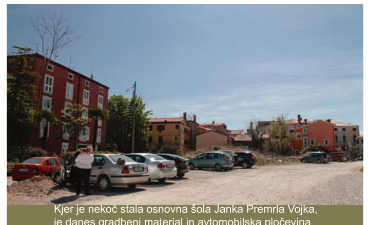
Kjer je nekoč stala osnovna šola Janka Premrla Vojka, je danes gradbeni material in avtomobilska ploščevina

Javno podajamo predlog, naj se imenuje stalno delovno telo Mestne občine Koper, ki bi ga sestavljali predstavniki KS Koper – Center, MOK in Luke Koper, ki bi se sestajal mesečno, četrtletno ali po potrebi, in obravnaval vpliv, ki ga imajo dejavnosti Luke Koper na prebivalstvo v neposredni bližini pristanišča. V okviru komisije bi bilo smiselno organizirati vodene ogledne Luke Koper, da bi se lokalno prebivalstvo podrobneje seznanilo z dejavnostmi, ki se odvijajo znotraj pristanišča, saj bi se na tak način vzpostavili boljši pogoji za sožitje med krajanji in Luko Koper. S takimi rednimi sestanki bi se lahko tudi izognili številnim nevšečnostim, ki jih povzročata slab pretok informacij o delovanju Luke Koper, ki pridejo do prebivalstva z zamudo ali ko je že prepozno, da bi se karkoli izboljšalo. Tak primer smo doživeli pred kratkim, ko se je brez posebnega obvestila začelo z miniranjem na potniškem terminalu. V primeru utečene komunikacije in sodelovanja bi se lahko še pravočasno vključili v razprave in postopek glede izgradnje 3. pomola in sprejema DPN koprškega pristanišča. Komisija župana, ki trenutno deluje na tem področju, nima stalnega člana z glasovalnimi pravicami, ki bi predstavljal KS Koper – Center, temveč je nekdo le samooklicani predstavnik naše krajevne skupnosti.