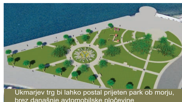
Ukmarjev trg bi lahko postal prijeten park ob morju, brez današnje avtomobilske pločevine

Predlagano je bilo tudi, da se po selitvi luške kapitanije na potniški terminal, ti prostori preuredijo tako, da bi bila v stavbi ribja restavracija, na zunanjih površinah pa bi obiskovalci uživali dobrote iz morja ob morju in istrski oz. naši avtohtoni glasbi. Nekdanja stavba stare policijske uprave na Ukmarjevem trgu bi se lahko v celoti namenjena ribištvu. V pritličju bi se lahko ribarnica hladilnica, ledomat, skladišče za ribiče in prostor za ribiško borzo. V prvem nadstropju pa ribiški muzej, na vrhu stavbe prostori za vsa ribiška društva in organizacije, za veterinarsko in fitosanitarno inšpekcijo, ribiško zadrugo, ribiško pisarno, skratka za vse dejavnosti, ki so povezane z ribištvom. Te dejavnosti bi lahko na primer prenesli tudi v zapuščeno skladišče Libertas, kar bi oživel ta del mesta in bi se širila promocija ribištva. Predlog, ki bi pripomogel k ohranitvi kulturne identitete kraja, izboljšanju pogojev delovanja ribiške dejavnosti in koristnem izkoristku obstoječe infrastrukture, je bil gladko zavrnen. Ne le to, tudi stavbe z bogato kulturno dediščino danes ni več.