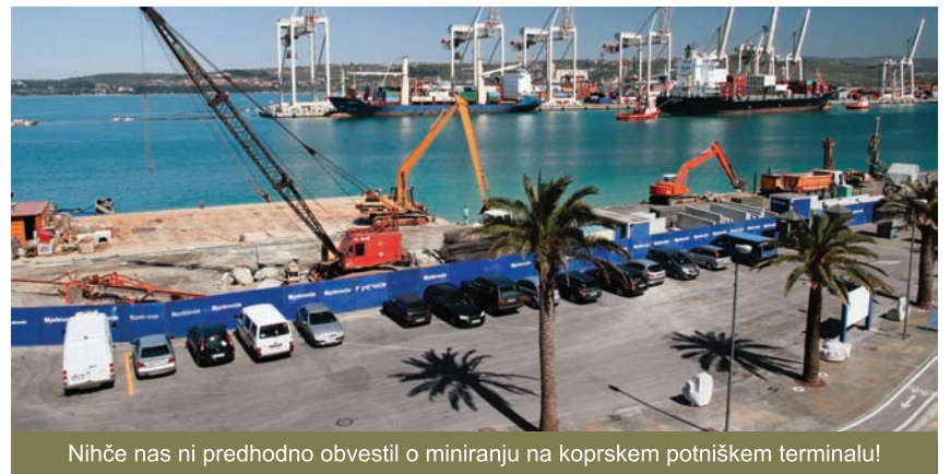
Nihče nas ni predhodno obvestil o miniranju na koprskem potniškem terminalu!

Krajanji mestnega jedra smo najbolj izpostavljeni hrupu in onesnaževanju iz koprškega pristanišča, kar je bilo v zadnjem obdobju močno občutiti. Prebivalcem mestnega jedra so se tresla tla pod nogami zaradi miniranja, ki jih je izvajala Luka Koper pri poglobljanju obale. Pred kratkim so delci prahu, ki so ušli pri pretovarjanju v koprskem pristanišču in ki naj bi vsebovali zdravju škodljive težke kovine, ohromili naše vsakdanje življenje. Štab civilne zaščite pri MOK je prebivalcem mestnega jedra priporočil, naj se raje zadržujejo v zaprtih prostorih. Z Luko Koper bi morali sodelovati veliko bolj konstruktivno, predvsem pri vidiku sobivanja v skupnem prostoru. Ljudem bi bilo treba zagotoviti enake pogoje življenja, kot jih imajo v drugih delih Mestne občine Koper in čim manj negativnih vplivov na njihovo zdravje. Mestna občina Koper bi morala izboljšati pogoje sodelovanja z Luko Koper, ki niso samo gospodarske narave. Občinska uprava ne bi smela delovati samo z namenom, da si izpolnjuje finančne interese, tudi na škodo nas prebivalcev. Včasih je treba sodelovati z roko v roki, kjer bi moral biti prvi cilj izboljšanje življenjskih razmer, ne pa, kot zdaj, kot je vse omejeno na izboljšanje finančnih rezultatov. Namesto, da bi občinska uprava gojila take namere, se zgodi ravno obratno in z njenim delovanjem povzroča škodo občanom in razvoju koprškega pristanišča.