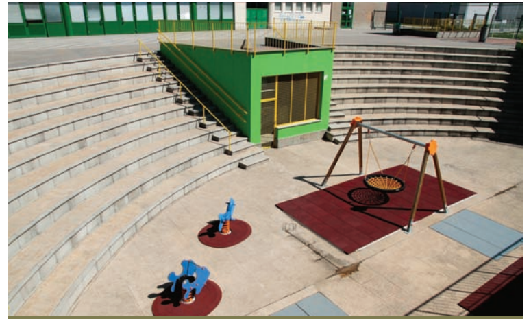
Nekdanji amfiteater za kulturne predstave je danes postalo otroško igrišče?

in vseh letnih časih. Na območju med Bonifiko, hitro cesto Bertoki – Žusterna, Piransko cesto in novim bazenom, bi se lahko razširila javna infrastruktura z večfunkcijskimi prireditvenimi objekti, ki bi se medsebojno dopolnjevali, od na primer pokritega prizorišča, do odkritega amfiteatra. Vse bi moralo biti zgrajeno v sožitju z že obstoječimi športnimi objekti in naravo v neposredni bližini. Lahko bi se uredil tudi ustrezeni učni park, kjer bi dobile mesto mediteranske rastline. Alternativna lokacija za prireditve bi se lahko uredila tudi ob železniški progi, kjer bi se lahko postavil tudi večji koncertni ali drugi kulturni prireditveni prostor. V mestnem središču je tudi vrsta za enkrat še neurejenih palač, ki so neizkoriščene glede na potencialne, ki bi jih lahko imele na primer pri izvedbi koncertov klasične glasbe. Zato menimo, da bi bila smiselna njihova prenova, saj bi se omogočila javna uporaba zdaj zapuščenih prostorov. Možnih rešitev je veliko, zamisli nam v Oljki – stranki slovenske Istre zagotovo ne manjka, treba jih je iskati skupaj s krajanji in z njihovim soglasjem. Realizacijo teh projektov bomo nemudoma začeli, takoj po volitvah in z novim županom na čelu.