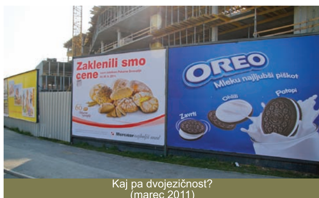
Kaj pa dvojezičnost? (marec 2011)

Dato che Popovič, Battelli e Scheriani sono molto sensibili ai problemi dei diritti delle minoranze, come abbiamo potuto constatare nel caso di Ancarano, non dubito che si sforzeranno a risolvere rapidamente la violazione delle leggi minoritarie nell'ambito della pubblicità tramite tabelle poste in zone pubbliche e a realizzare i diritti dei residenti in una zona etnicamente mista.