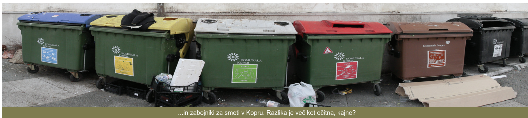
...in zabojniki za smeti v Kopru. Razlika je več kot očitna, kajne?