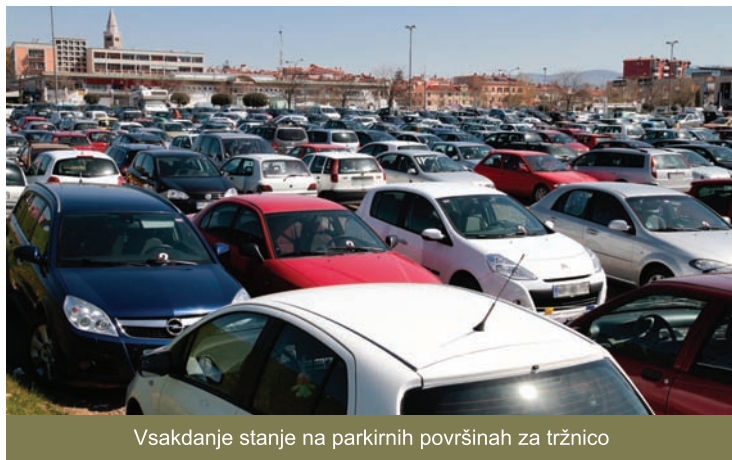
Vsakdanje stanje na parkirnih površinah za tržnico

Prebivalci mestnega jedra smo postali stranska škoda razvoja občine, ki nima več ne vizije ne kompasa. Sprva so nam bila odvzeta parkirna mesta in močno omejena na eno dovolilnico za vsako gospodinjstvo in še ta so plačljiva (Odluk o prometni ureditvi v starem jedru mesta Koper, Ul. RS 79/07; spremembe in dopolnitve Odloka Ul. RS 24/10). Kje so tisti lepi časi, ko smo lahko parkirišča uporabljali brezplačno, prebivalci mestnega jedra pa smo za vsa svoja vozila imeli tudi ustrezne dovolilnice? V ostalih delih občine so parkirišča še zdaj večinoma brezplačna, ali smo mi manj vredni občani? To je nedopustna diskriminacija! Poleg tega koprsko mestno jedro ostaja polno avtomobilske pločevine, kje so torej učinki do prebivalcev tako strogega odloka? Parkirne površine so tako zasedene, da je vse težje najti parkirno mesto celo na plačljivih območjih. Vsekakor potrebujemo večjo garažno hišo, ki bi uredila potrebe po parkirnih mestih v samem mestnem središču. Na tak način bi lahko tudi mi stanovalci