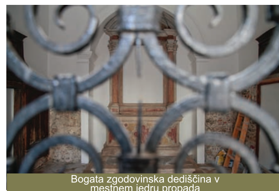
Bogata zgodovinska dediščina v mestnem jedru propada

Kopski turistični potenciali so nešteti in jih je potrebno začeti izkoristiti takoj, saj moramo ciljati na višjo kakovost turizma. Nesmiselno je, da se turisti, ki v Koper priplujejo s čezoceankami, z avtobusi vozijo v Lipico, Postojno ali Ljubljano, mimo Kopra. Tem in drugim turistom, pa tudi domačinom, bi morali ponuditi ogled kopskih zgodovinskih bogastev, saj bi s tem pripomogli tudi k njihovem ohranjanju. Po občinskih volitvah bomo jasno začrtali novo politiko turizma v Kopru, ki bo zaustavila in ne bo več dopustila vnosa tujkov v mesto z bogato kulturno