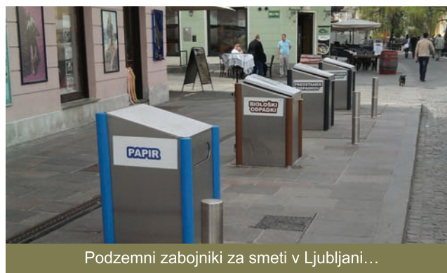
Podzemni zabojniki za smeti v Ljubljani...

Ko se sprehajam po Kopru me moti, da na večjem delu Pristaniške ulice niso urejeni niti koši za odlaganje smeti, kar je verjetno posledica pozabljivosti in površnega načrtovanja. Premalo je tudi klopi, v poletnih časih se na promenadi občuti bistveno povečana temperatura, ker palme ne dajejo nobene sence. To je težava, ki zelo pesti starejše osebe in tiste z zdravstvenimi težavami.