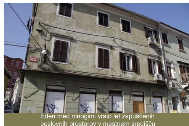
Eden med mnogimi vrsto let zapuščenih poslovnih prostorov v mestnem središču

Servitski samostan in številne druge. Koper premore več kot 30 vodnjakov, več deset zanimivih vrtov in desetine različnih dimnikov. Zanimivi so tudi izkopi, kjer vedno bolj pogosto ugledajo luč sveta izjemna odkritja. Pred dnevi smo bili seznanjeni s pomembno najdbo iz zgodnje rimske dobe znotraj Servitskega samostana.