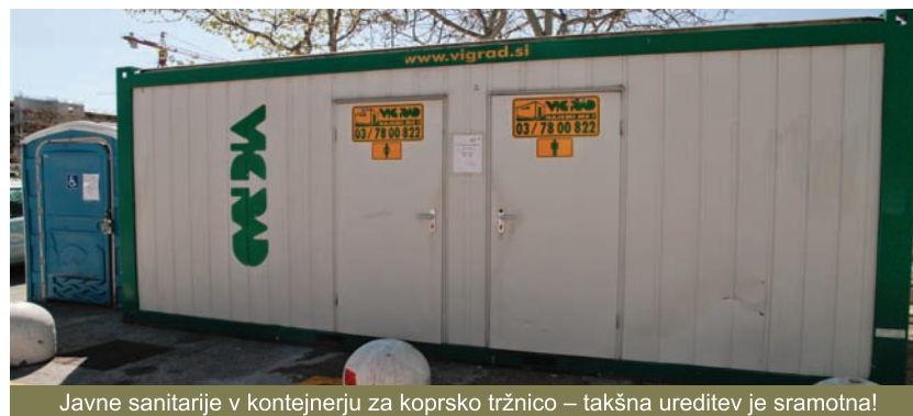
Javne sanitarije v kontejnerju za kopsko tržnico – takšna ureditev je sramotna!

Kljub temu, da imamo prenovljeno promenado, ki zaokroži celotno mestno jedro, se ni poskrbelo niti za javne sanitarije, ki so prepotrebne. Zabojnik s sanitarijami, ki je postavljen ob kopski tržnici, je sramota za mesto, ki želi kotirati kot turistično mesto. Ustrezne javne sanitarije so zelo pomembne za osebe, ki imajo zdravstvene težave, za otroke in starejše občane ali obiskovalce mesta. Če so javna stranišča »ogledalo mesta«, lahko le ugibamo o tem, v kakšnem mestu živimo. To področje, kot številna druga, je zanemarjeno zaradi neprimerne načrtovanja razvoja mesta. V Oljki – stranki slovenske Istre predlagamo, da bi se pristopilo k celostni ureditvi javnih sanitarij. Lokacije, kjer bi nujno potrebovali urejene javne sanitarije (ne samo zabojnike ali prenosna biološka stranišča), so na primer ob postajališču za taksije oz. pri tržnici, pri ribiškem pomolu oz. ob kopskem mandraču – Porporella (morda v bližini luške kapitanije), na ŠRC Bonifika (na primer ob skate ploščadi), ob potniškem terminalu in še marsikje drugje. Občinsko upravo pozivamo, naj nemudoma začne vzpostaviti dostojne javne sanitarije in s tem dvigne ugled Kopra, predvsem pa poskrbi za javno čistočo in higieno.